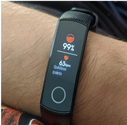
Figura 2. Medición de Sat O 2 – Honor® Band 5.

Este dispositivo cuenta con un pulsioxímetro (Figura 1), que por medio de diodos emisores de luz (LED) transmite diferentes longitudes de onda de luz a través de la piel hacia el tejido, estas longitudes de onda son absorbidas diferencialmente por la oxihemoglobina (HbO 2 ) de la sangre, que es de color rojo, y la desoxihemoglobina, que es de color azul. Un fotodetector también localizado en el sensor (generalmente situado en el lado opuesto al LED) convierte la luz transmitida en señales eléctricas proporcionales a la absorbancia. El microprocesador del oxímetro procesa las señales y muestra la lectura de SpO 2 en un lapso de quince segundos (Figura 2).