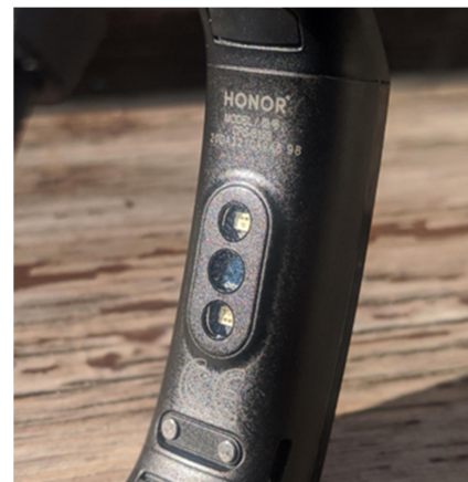
Figura 1. Pulsioxímetro integrado Honor® Band 5.

Al agregar datos de la persona a una aplicación enlazada a un dispositivo móvil, se determina el índice de masa corporal (IMC), tasa de metabolismo basal (TMB) y gasto calórico. 8 Algunos dispositivos también contienen sensores adicionales como altímetros, monitores de frecuencia cardíaca y de saturación de oxígeno.